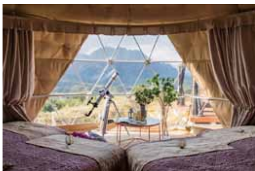
delux7 様ドーム 内観