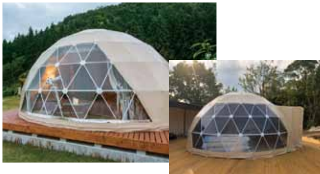
delux7 様ドーム 外観